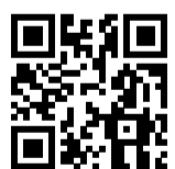
Ersatzhaltestelle Richtung Berlin/Cottbus

Richtung Beeskow: Verlassen Sie den Bahnsteig durch die Unterführung und begeben Sie sich in Richtung Busbahnhof (ZOB) an der Storkower Straße. Halten Sie sich nach dem Ausgang der Unterführung links und folgen Sie dem Weg zum Busbahnhof (ZOB). Die Ersatzhaltestelle befindet sich an der Haltestelle Königs Wusterhausen, Bahnhof Haltestelle Nr. 8 am ZOB.