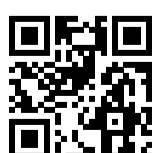
Ersatzhaltestelle Richtung Beeskow

* Fahrradmitnahme im Schienenersatzverkehr nur begrenzt möglich. Im QR Code sind die Koordinaten der Ersatzhaltestelle hinterlegt.